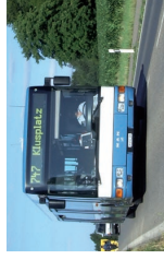
ATE Bus AG